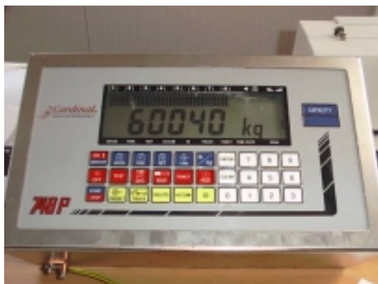
Pokazivanje Max + 2e