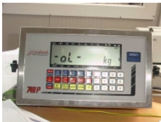
Pokazivanje Max + 9e ol (over load) = prekoračenje Max